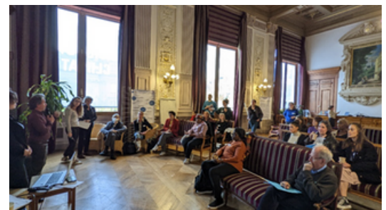
Evenement de restitution du 9 novembre 2022, Académie du Climat, Paris

Enrichissement de l'avis par les travaux citoyens