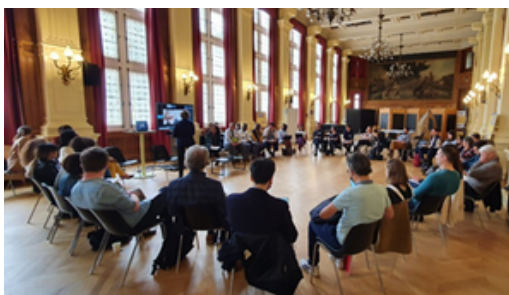
Rencontre entre le groupe de concertation du CNA et des porte-paroles du panel le 19 avril 2022

Un événement de restitution a été organisé le 9 novembre 2022 pour échanger avec les participantes et participants de la démarche de la manière dont ont été étudiées et prises en compte les propositions citoyennes.