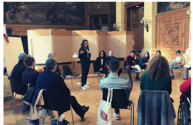
Panel citoyen sur la prévention et la lutte contre la précarité alimentaire - 2022

En savoir plus sur ces démarches participatives.