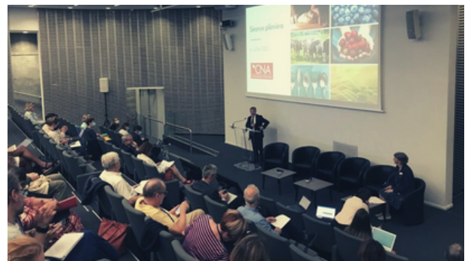
Séance plénière du CNA au ministère de la transition écologique - juillet 2022

Enfin, le Secrétariat interministériel du CNA , organise et anime les activités du CNA, sous l'égide de la présidence.