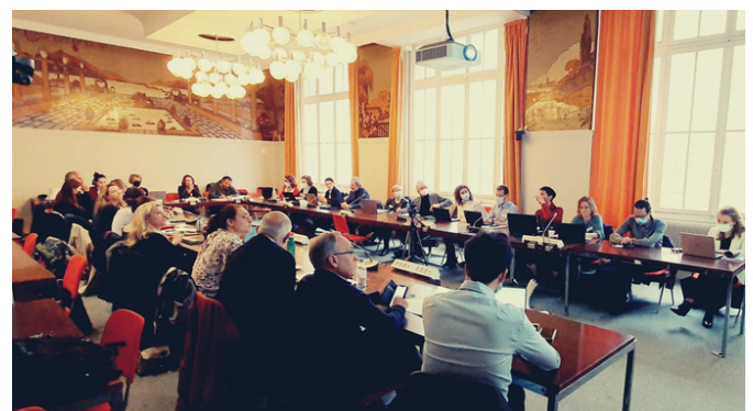
Réunion de concertation du groupe "Nouveaux comportements alimentaires" - avril 2022