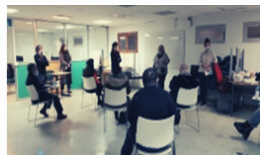
Atelier exploratoire sur le thème des emballages alimentaires avec des bénéficiaires du Secours populaire - Marseille, 2021

Avec l'appui de la CNDP, le CNA conduit une expérimentation de l'ouverture à la participation citoyenne, en parallèle d'une concertation sur les emballages alimentaires. Trois ateliers exploratoires et un panel citoyen sont mis en place. Une centaine de propositions sont formulées par les citoyennes et les citoyens pour nourrir la concertation.